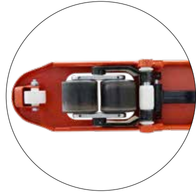
Ein- und Ausfuhrrollen